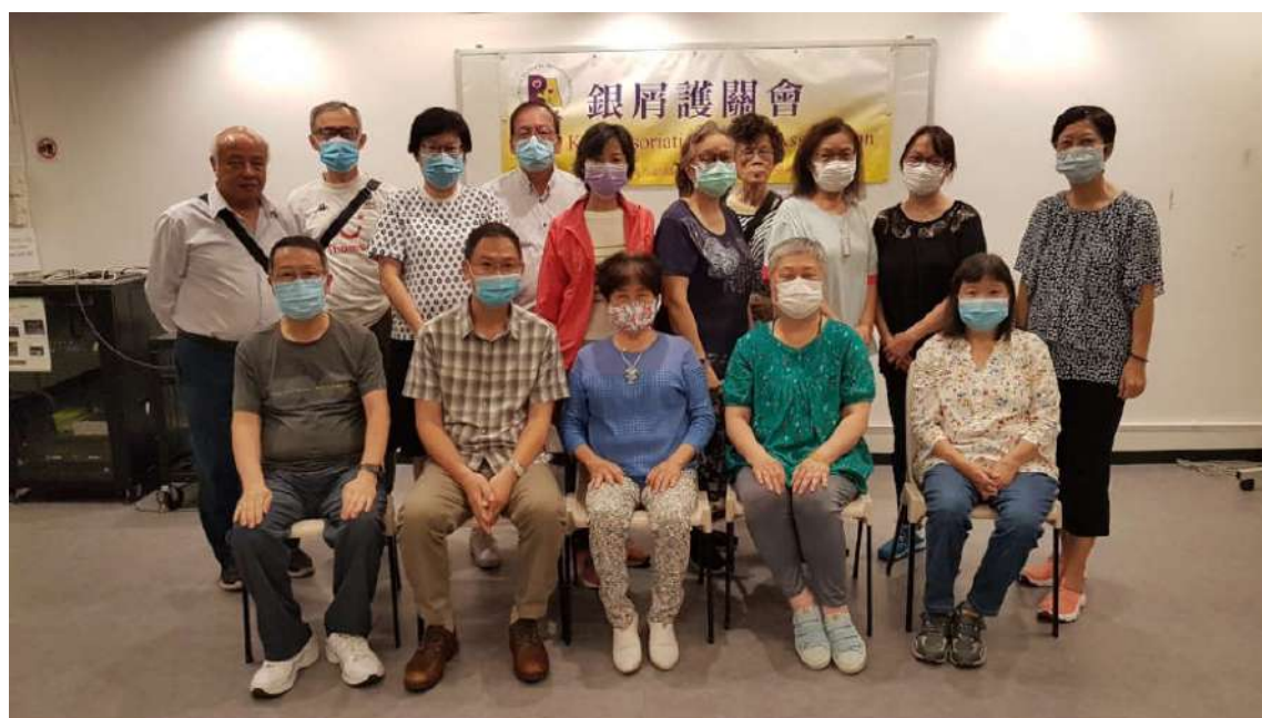
銀屑護關會*2020週年大會